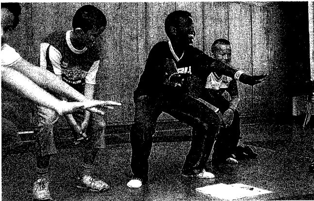
Buben beim Versuch die Balance zu halten.

Auf der anderen Seite erwies sich die Integration des Trainings in den Unterricht und die Einbindung der Lehrkräfte auch als Gewinn: Nur mit einer guten Vor- und Nachbereitung des Gelernten kann bei den Mädchen und Buben eine nachhaltige Wirkung erzielt werden. Kompakter, länger und für mehr Kinder wünschten sich die beteiligten LehrerInnen die Kurse. «Eigentlich müsste mit den Schülerinnen und Schülern in jeder Schulstufe ein Selbstbehauptungstraining durchgeführt werden – der Schulpolizist kommt schliesslich auch jedes Jahr in die Klasse», so das Fazit einer Schulleiterin.