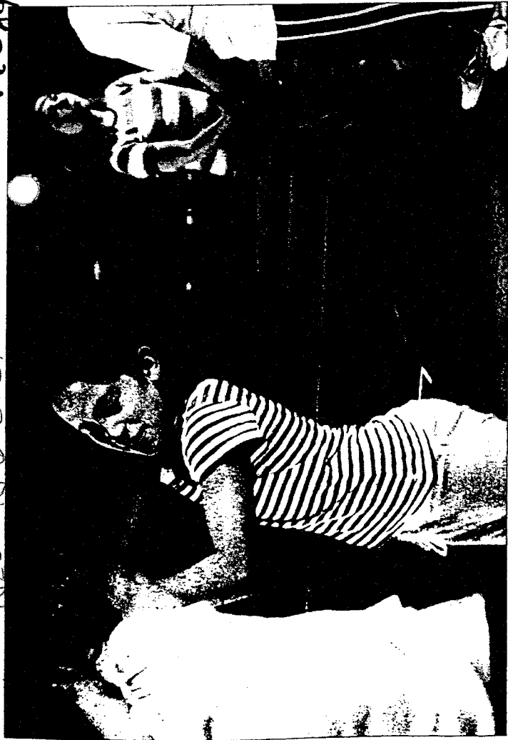
Grenzen setzen, auf Angriffe selbstsicher reagieren und sich im Notfall wirksam wehren: Sechstklässlerinnen aus dem Schulhaus Milchbuck üben, sich gegen Angriffe zu verteidigen.